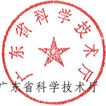
广东省科学技术厅