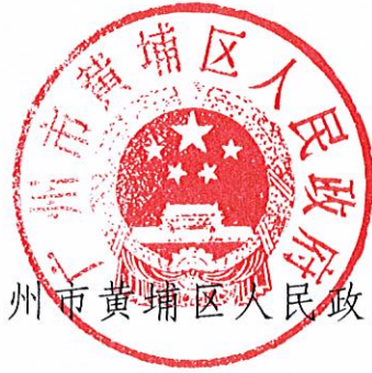
广州市黄埔区人民政府