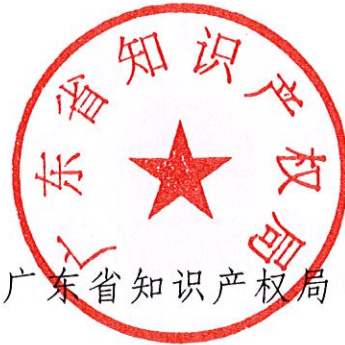
广东省知识产权局