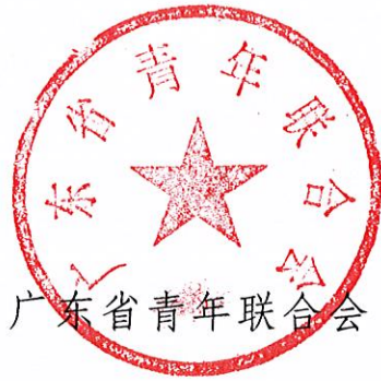
广东省青年联合会