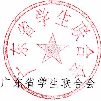
广东省学生联合会