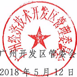
广州开发区管委会