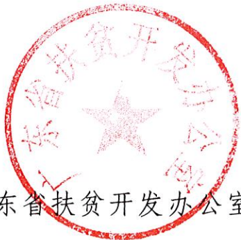
广东省扶贫开发办公室