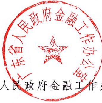
广东省人民政府金融工作办公室